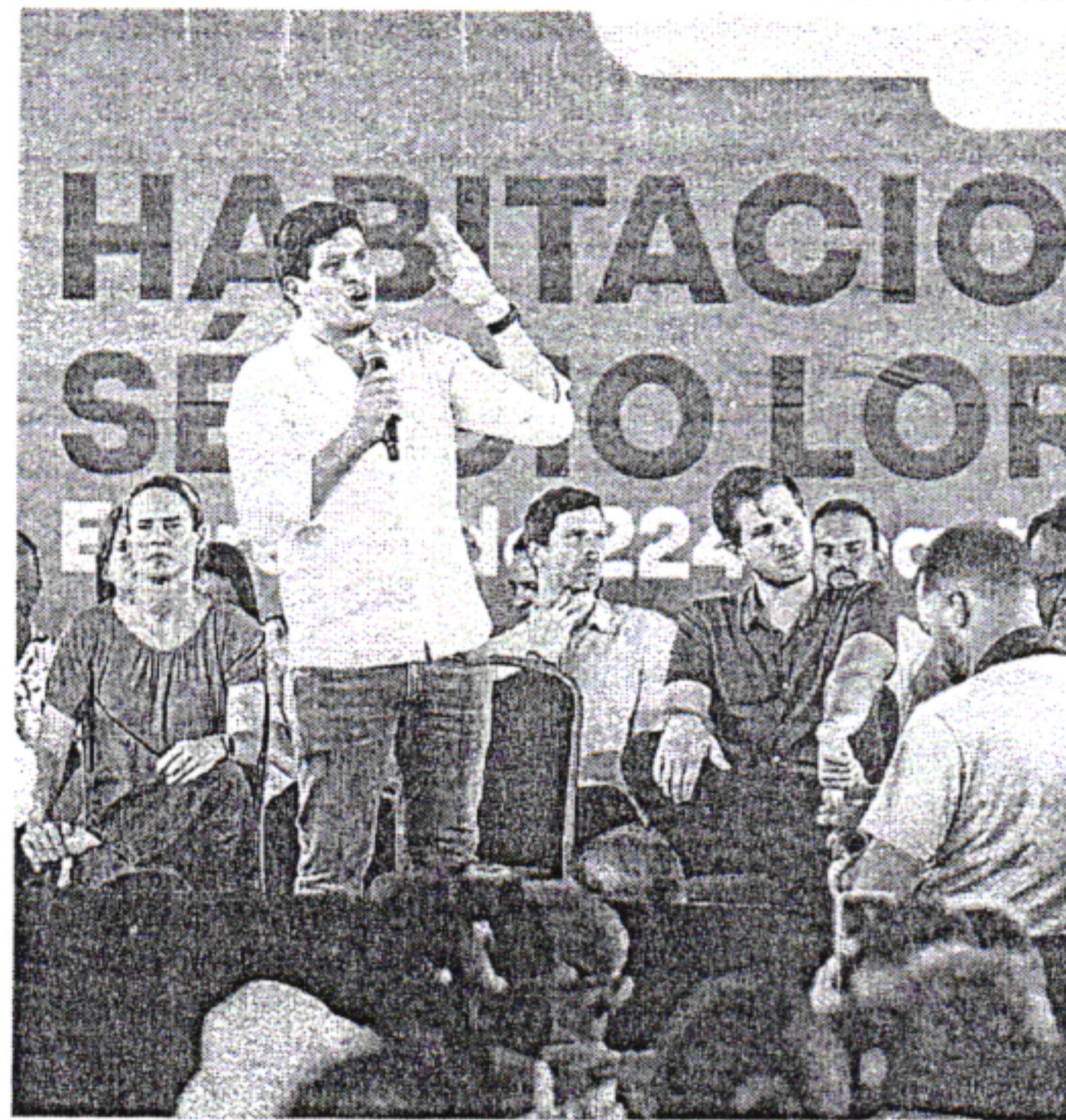
Prefeitura do Recife disse que vai bancar as mudanças

Os idosos e pessoas com deficiência foram priorizados com apartamentos nos imóveis nos andares inferiores