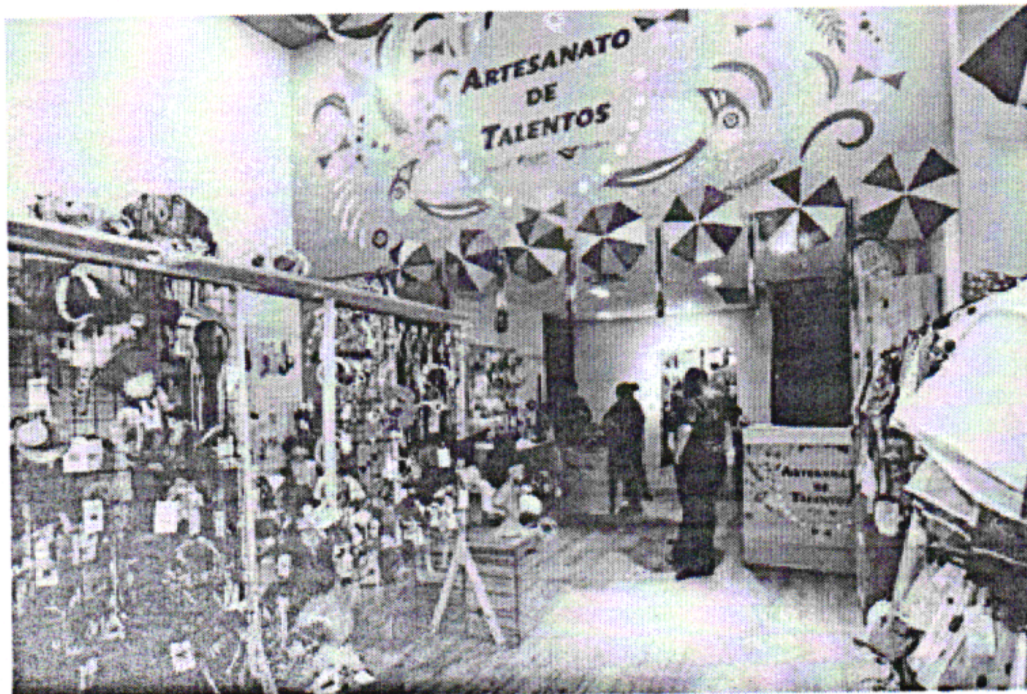
Durante o período carnavalesco, a loja Artesanato de Talentos comercializou fantasias e adereços produzidos por 19 artesãs e artesãos do Pina e Brasília Teimosa

Durante um mês de funcionamento no RioMar Recife, os espaços colaborativos comunitários registraram juntos faturamento de cerca e R$ 80 mil