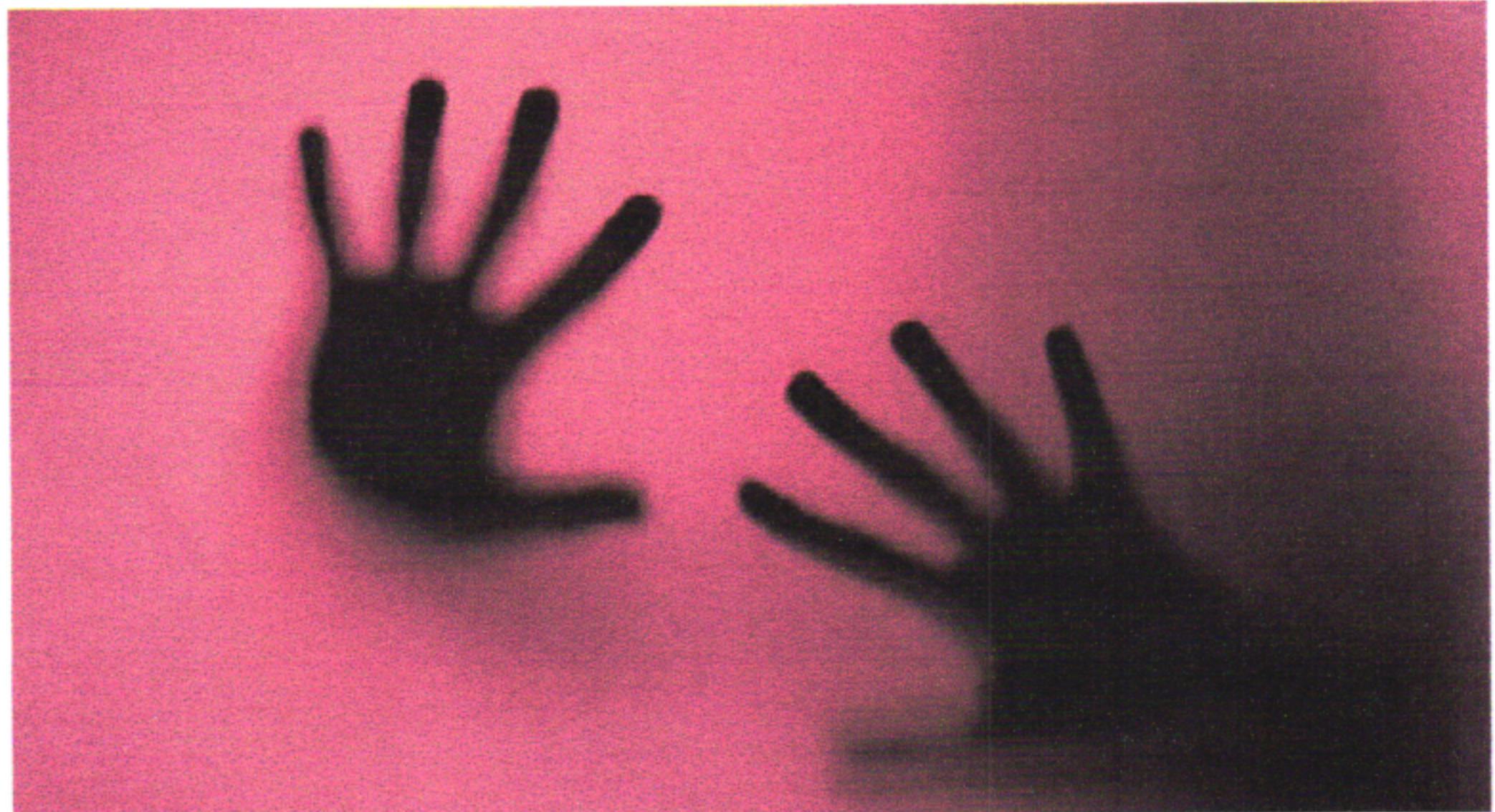
Levantamento considerou o recorte específico com mulheres negras, por esse grupo ser o mais vulnerável à violência no país

rou o recorte específico com mulheres negras, por esse grupo ser o mais vulnerável à violência no país.