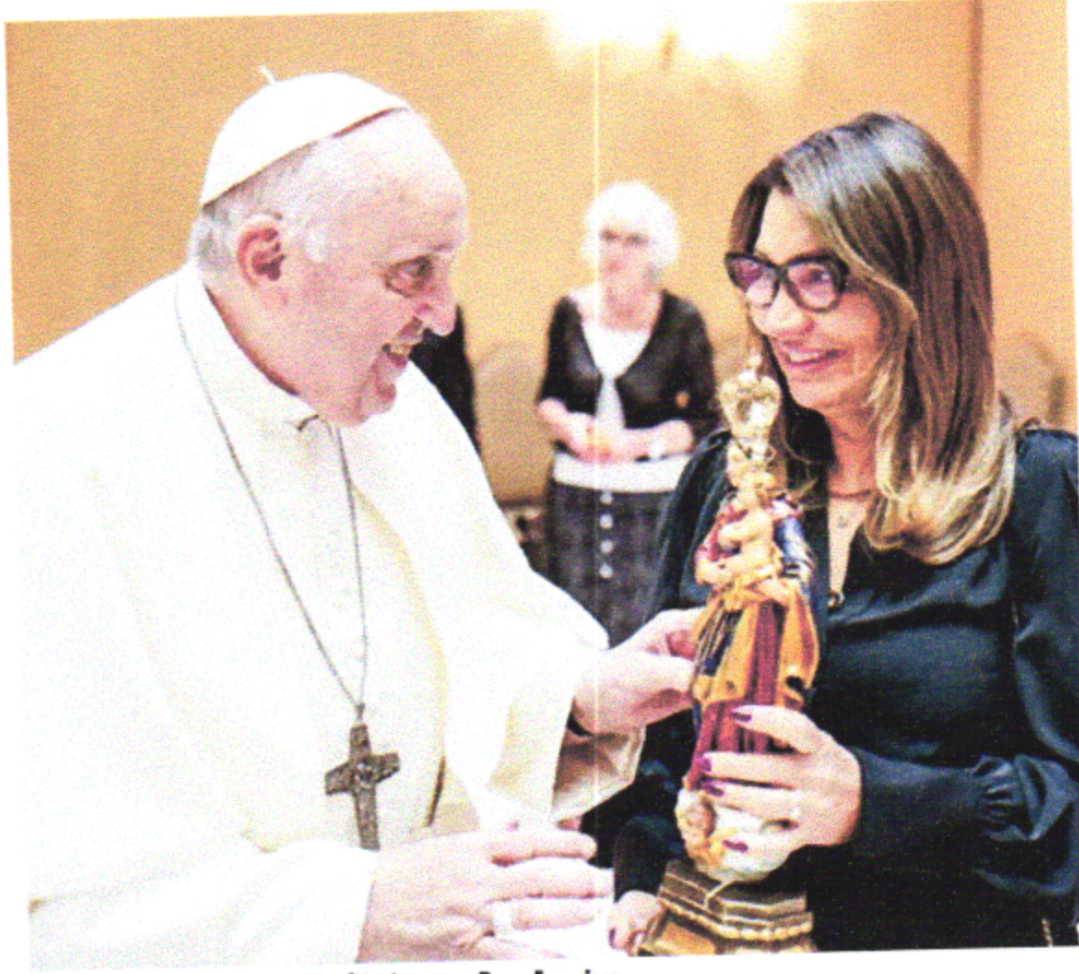
A primeira-dama terá uma audiência com o Papa Francisco

"Vocês vão me ver andar pelo Brasil com vários ministros. A gente vai mostrar um pouquinho dos resultados dos programas e das políticas sociais do governo do presidente Lula", diz a primeira-dama.