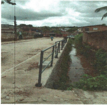
GUARDA-CORPO EM TUBOS DE AÇO GALVANIZADO (ALTURA = 0,90), COM BARRAS VERTICAIS A CADA 2,00M (2"), BARRA HORIZONTAL INTERMEDIÁRIA (2") E BARRA HORIZONTAL SUPERIOR (2")