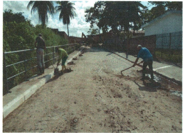
GUARDA-CORPO EM TUBOS DE AÇO GALVANIZADO (ALTURA = 0,90), COM BARRAS VERTICAIS A CADA 2,00M (2"), BARRA HORIZONTAL INTERMEDIÁRIA (2") E BARRA HORIZONTAL SUPERIOR (2")