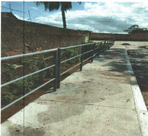
GUARDA-CORPO EM TUBOS DE AÇO GALVANIZADO (ALTURA = 0,90), COM BARRAS VERTICAIS A CADA 2,00M (2"), BARRA HORIZONTAL INTERMEDIÁRIA (2") E BARRA HORIZONTAL SUPERIOR (2")