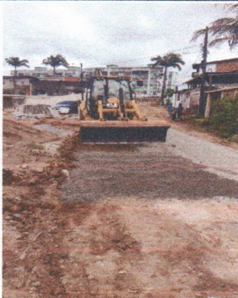
TRAV RUA CAROLINE BORBA DE LIMA