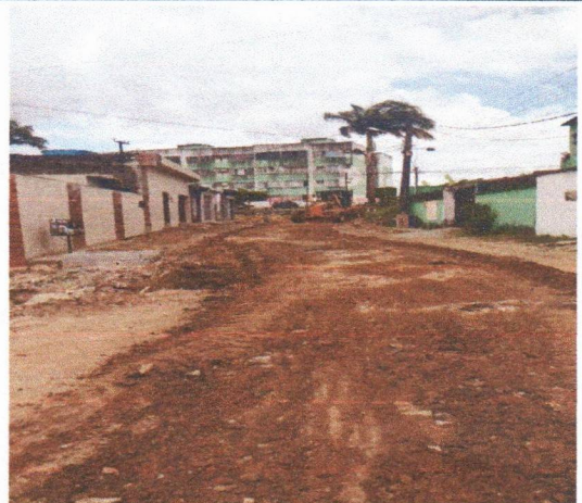
TRAV. RUA CAROLINE BORBA DE LIMA