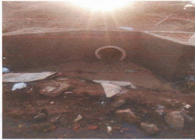
RUA CAROLINE BORBA DE LIMA