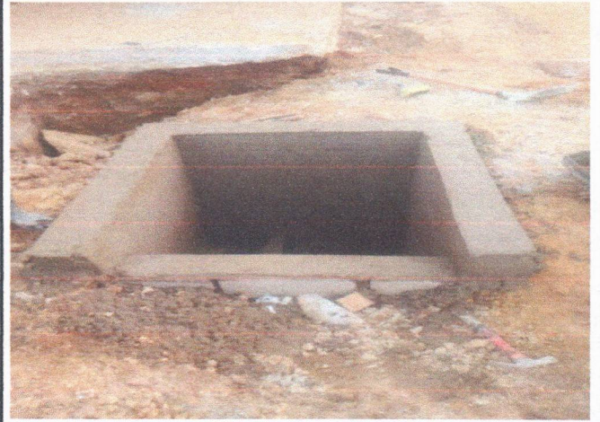
RUA CAROLINE BORBA DE LIMA