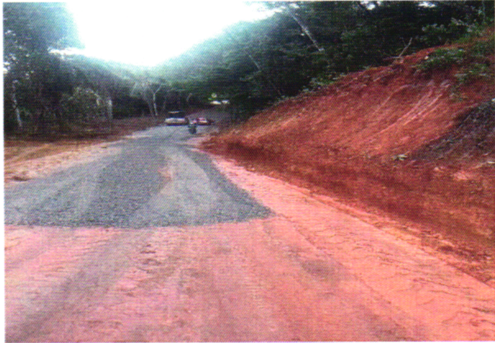
EXECUÇÃO BGS 7