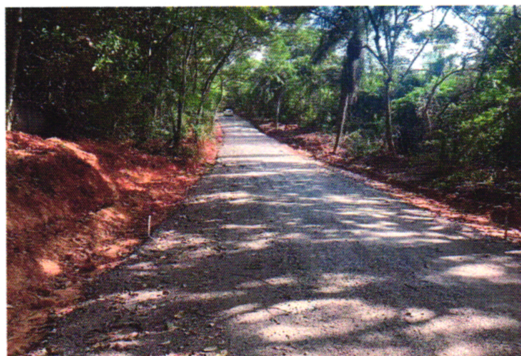
EXECUÇÃO BGS 4