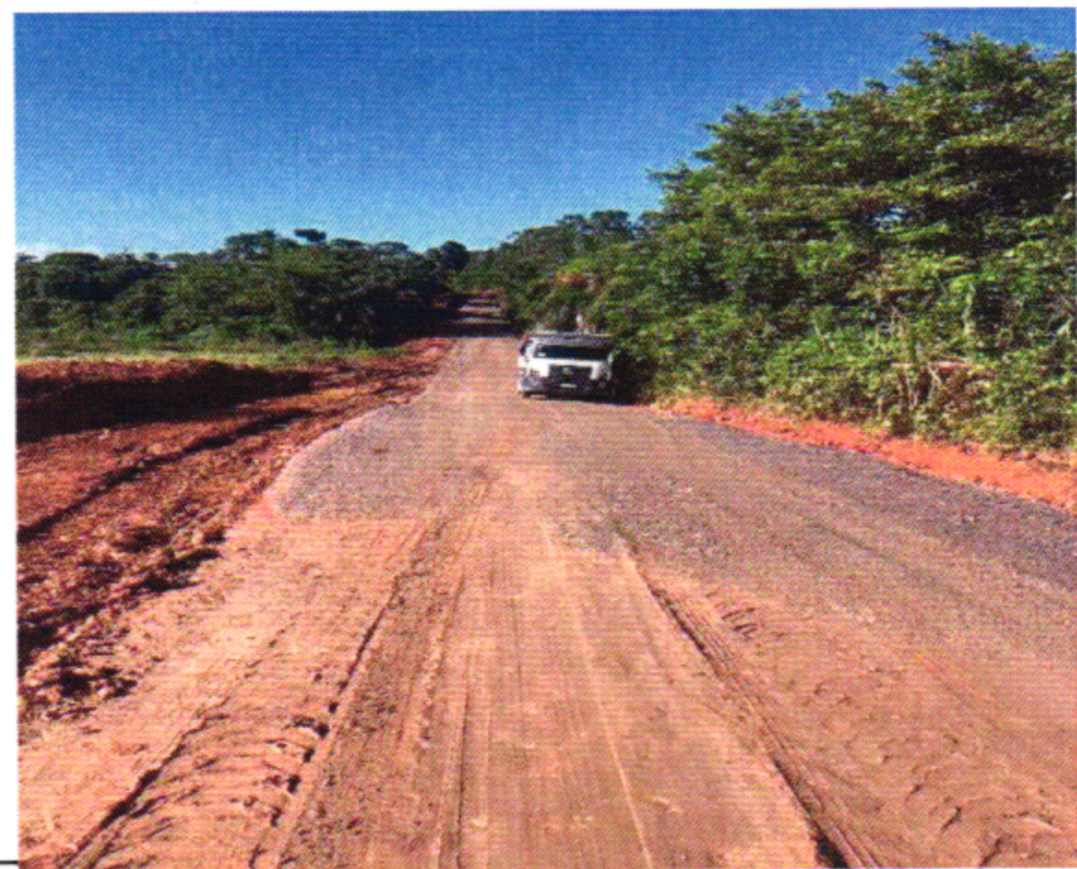
EXECUÇÃO BGS 14