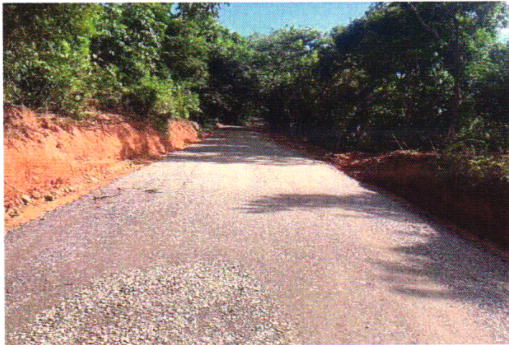
EXECUÇÃO BGS 11