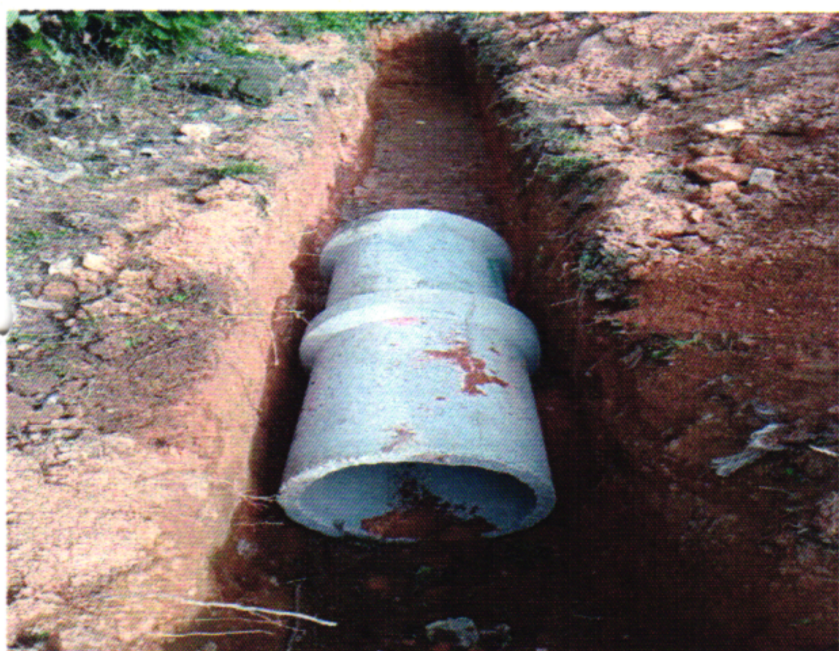
DRENAGEM TUBO 600MM