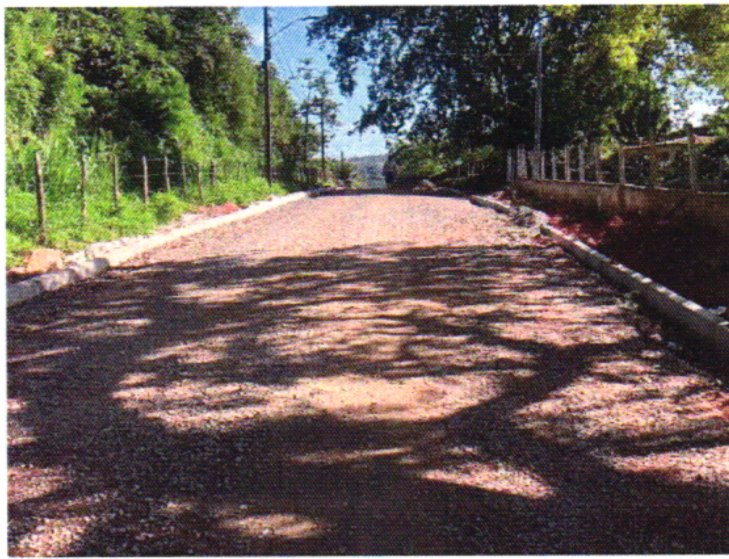
MEIO FIO 1