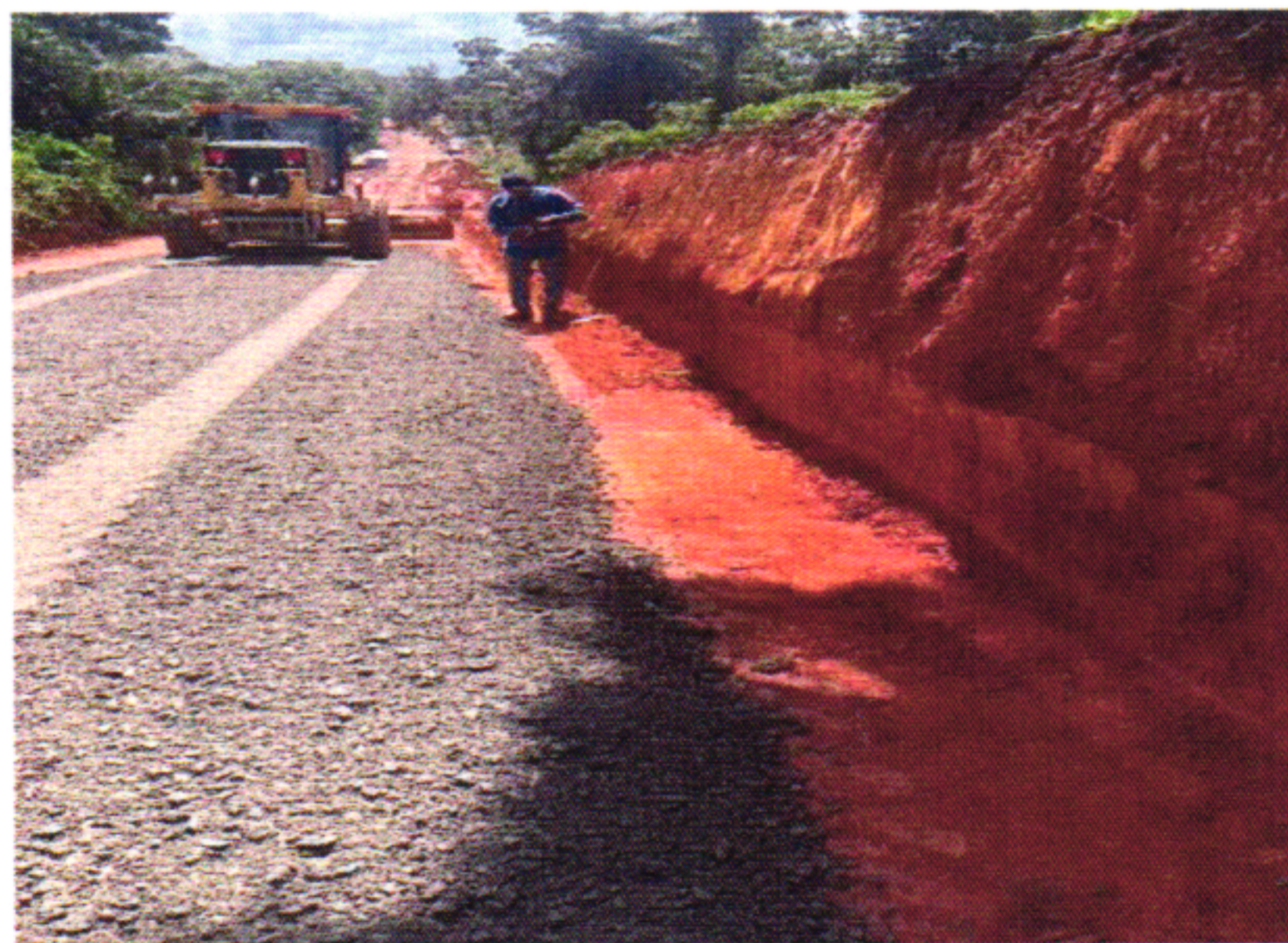
EXECUÇÃO BGS 1