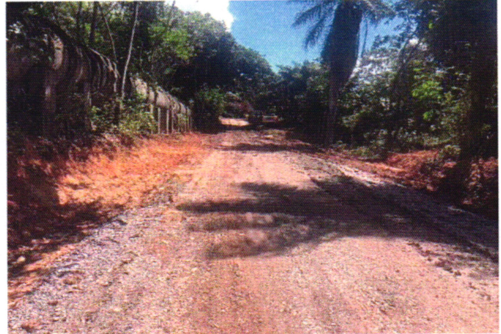
EXECUÇÃO BGS 8