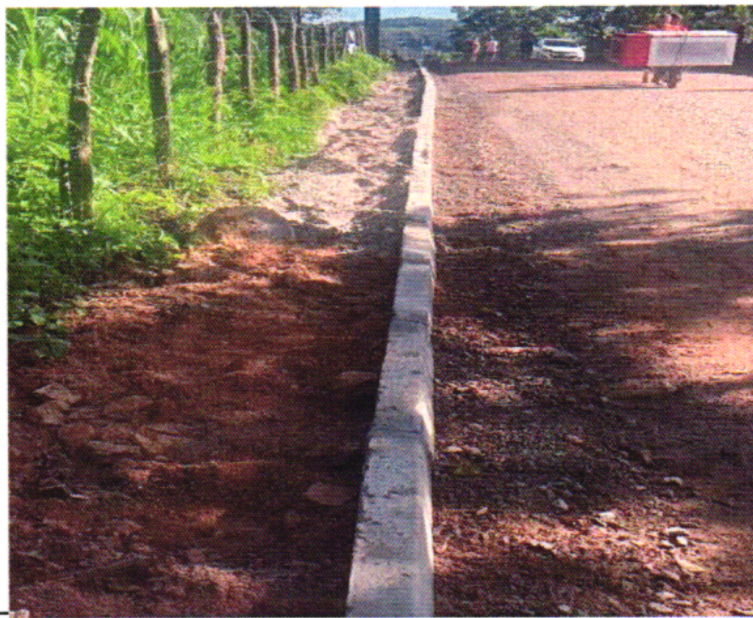
MEIO FIO 3