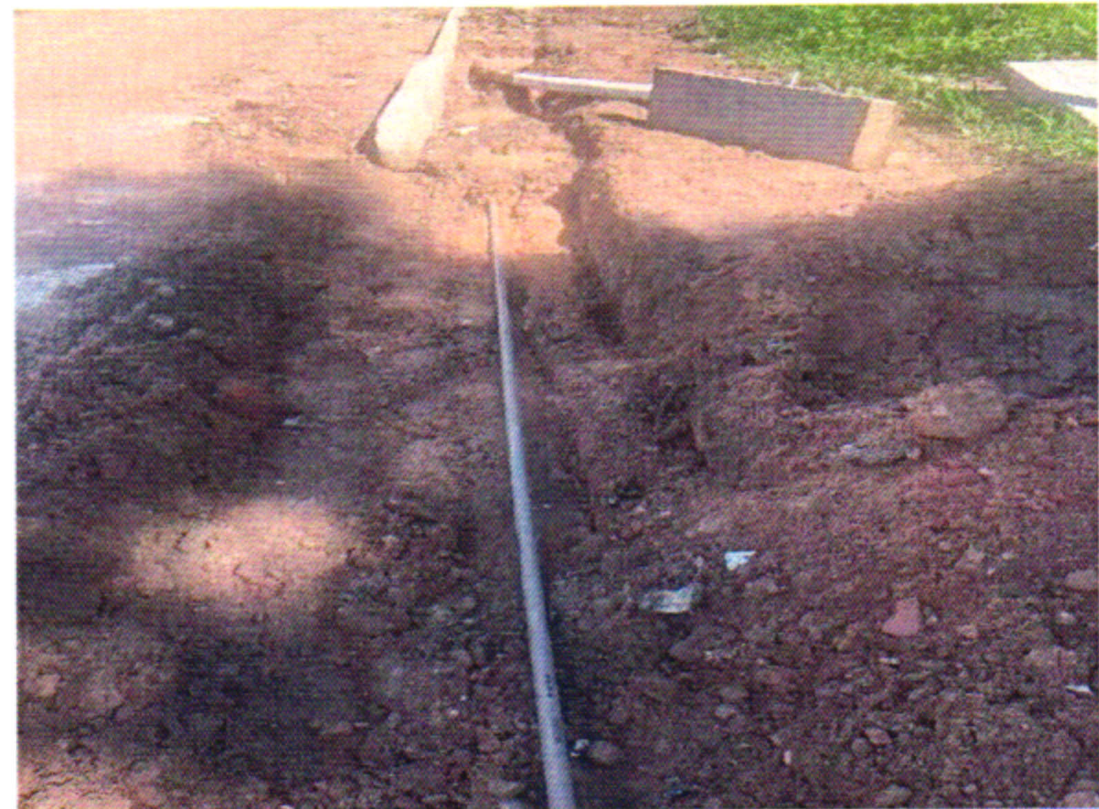
REBAIXAMENTO DE REDE 2