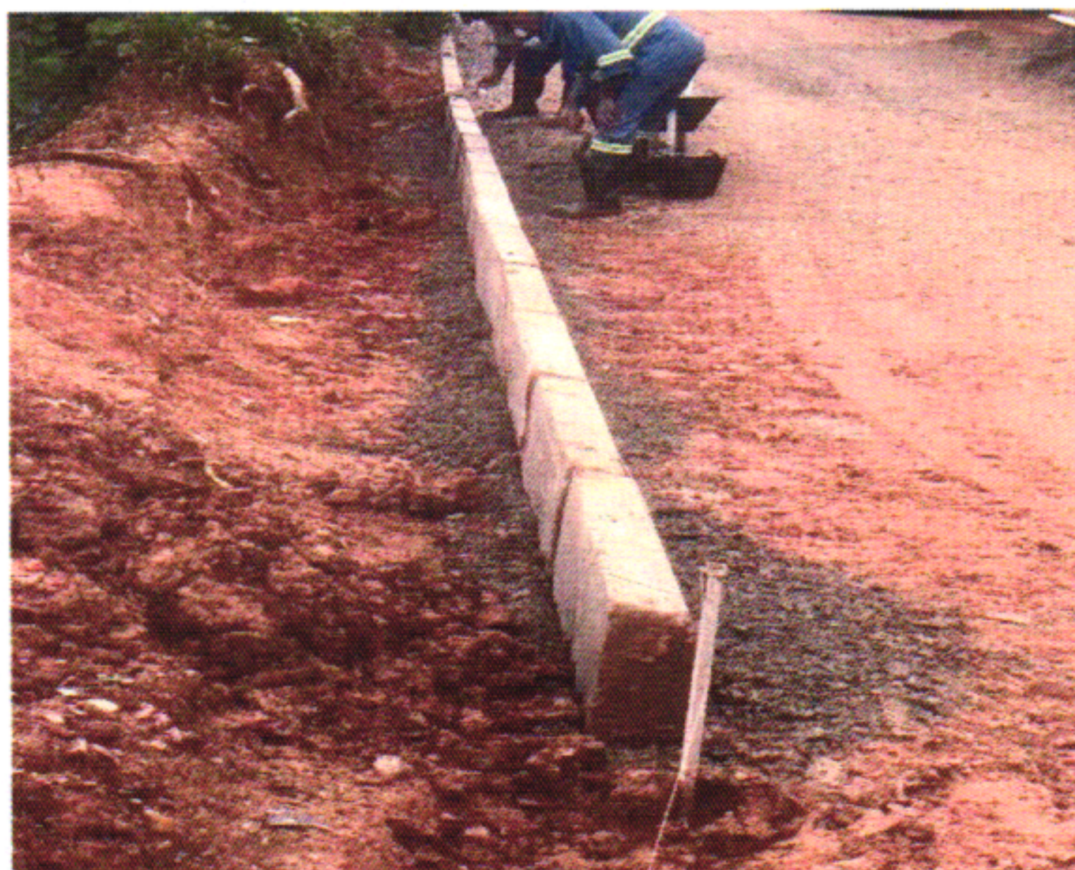
MEIO FIO 5