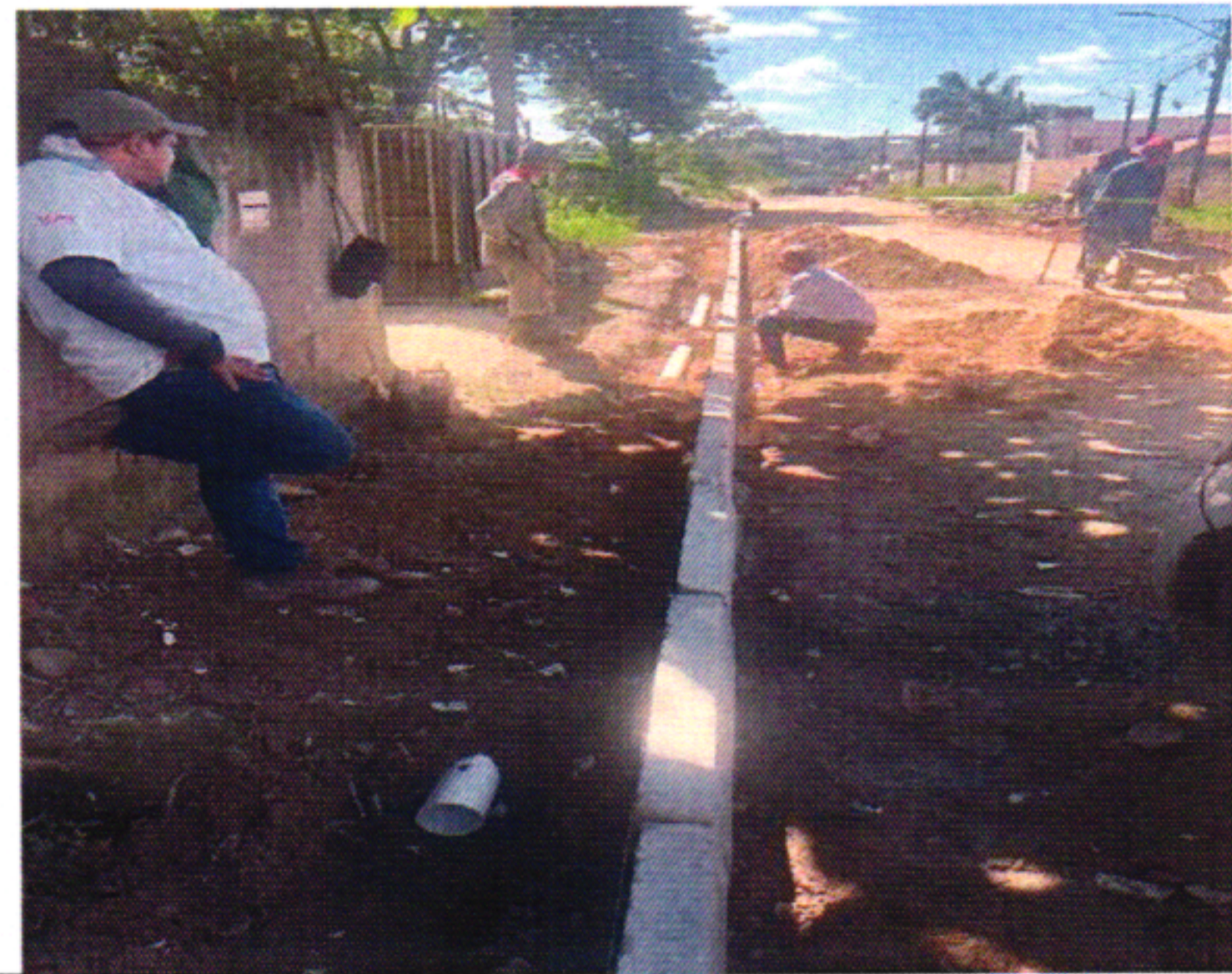
MEIO FIO 4