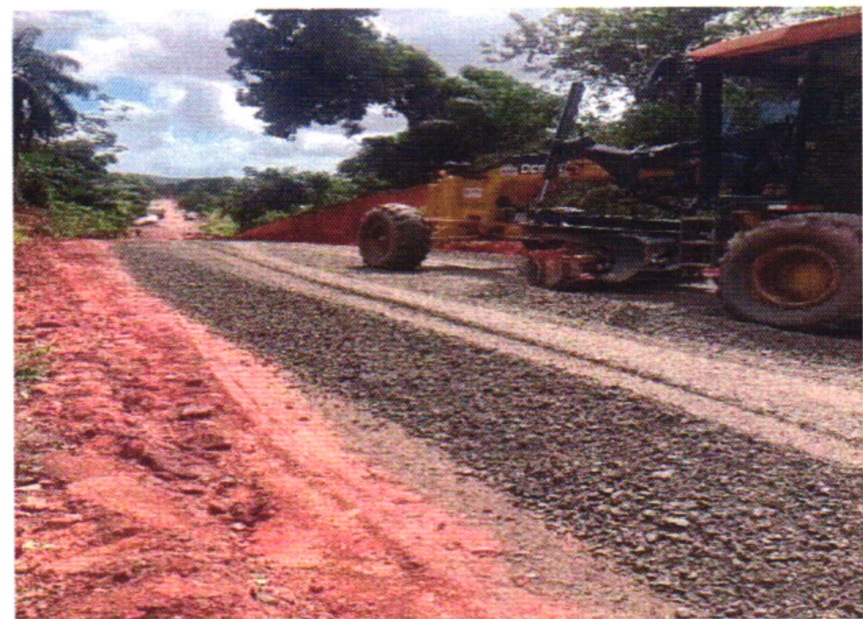
EXECUÇÃO BGS 2