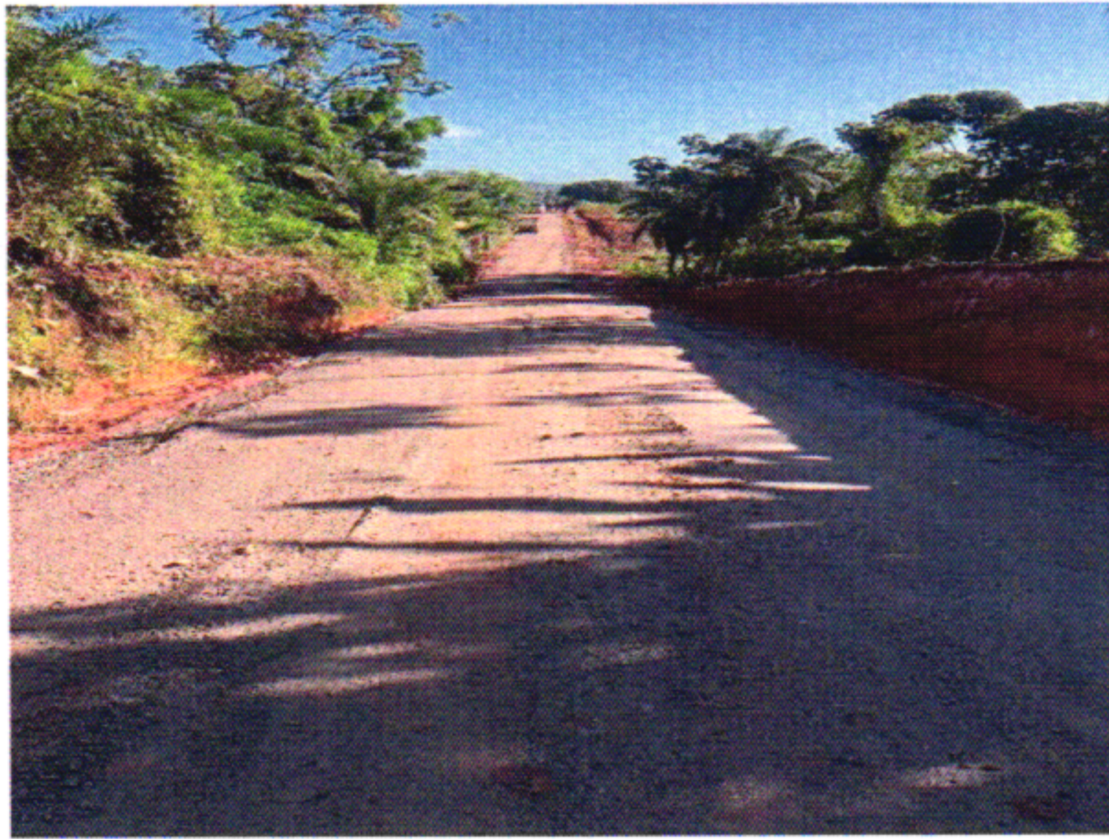
EXECUÇÃO BGS 9