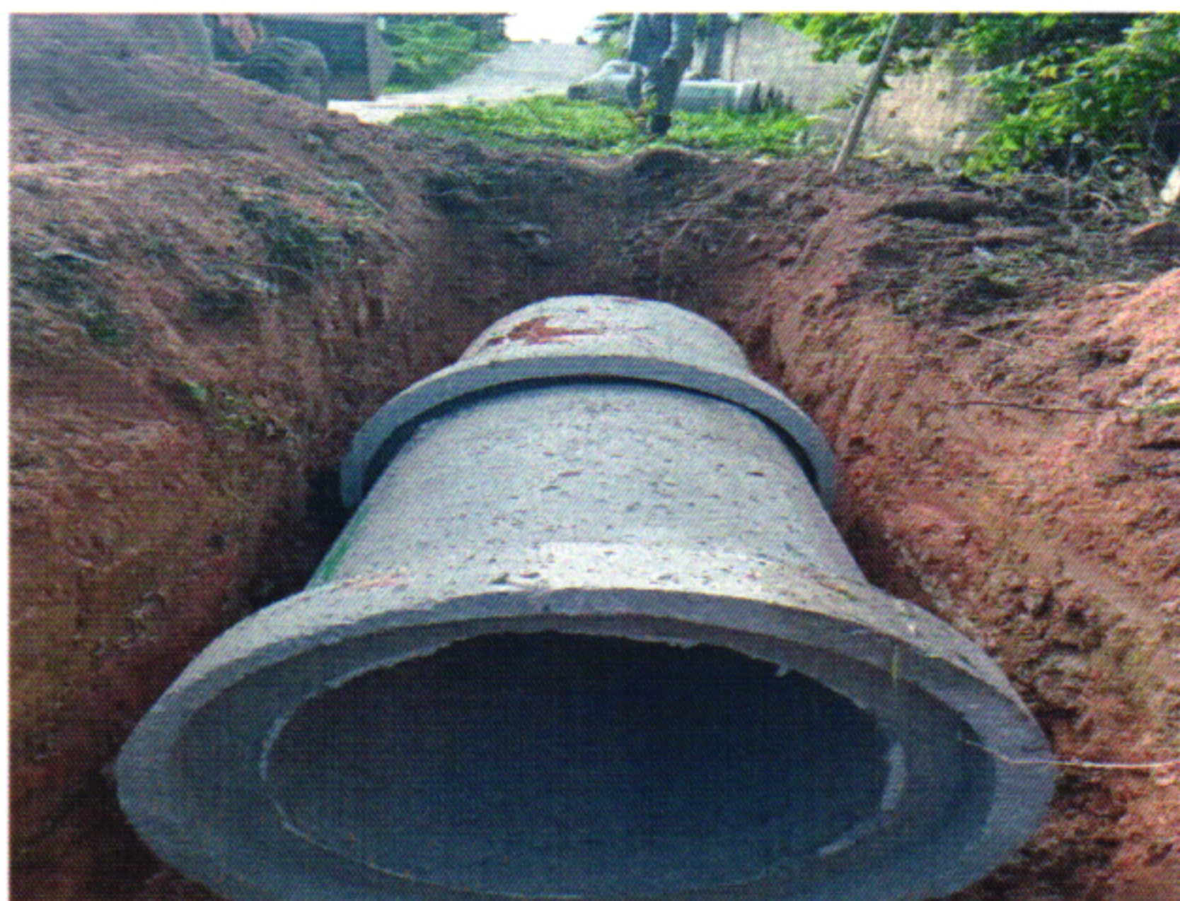
DRENAGEM TUBO 600MM 2