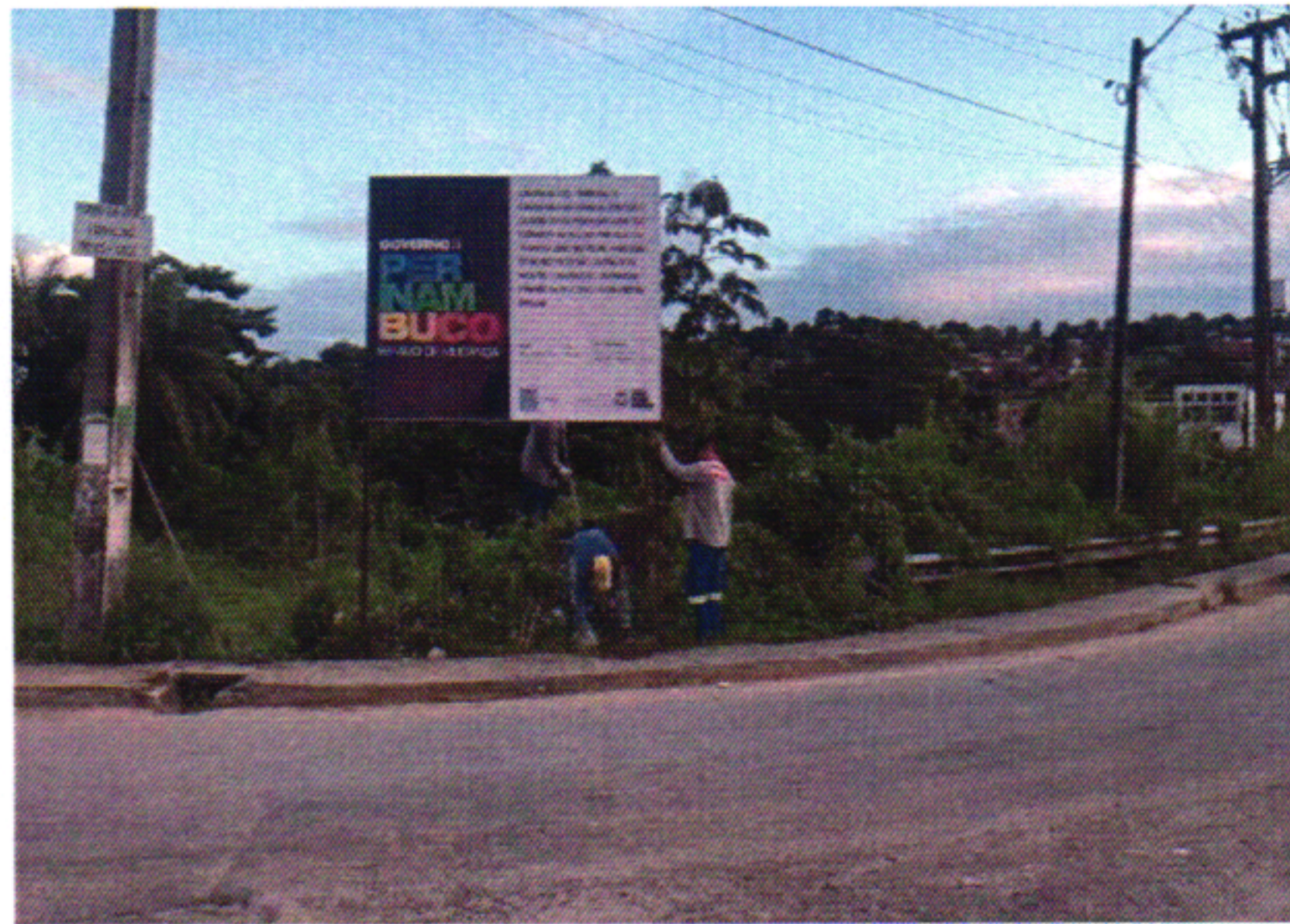
PLACA DA OBRA