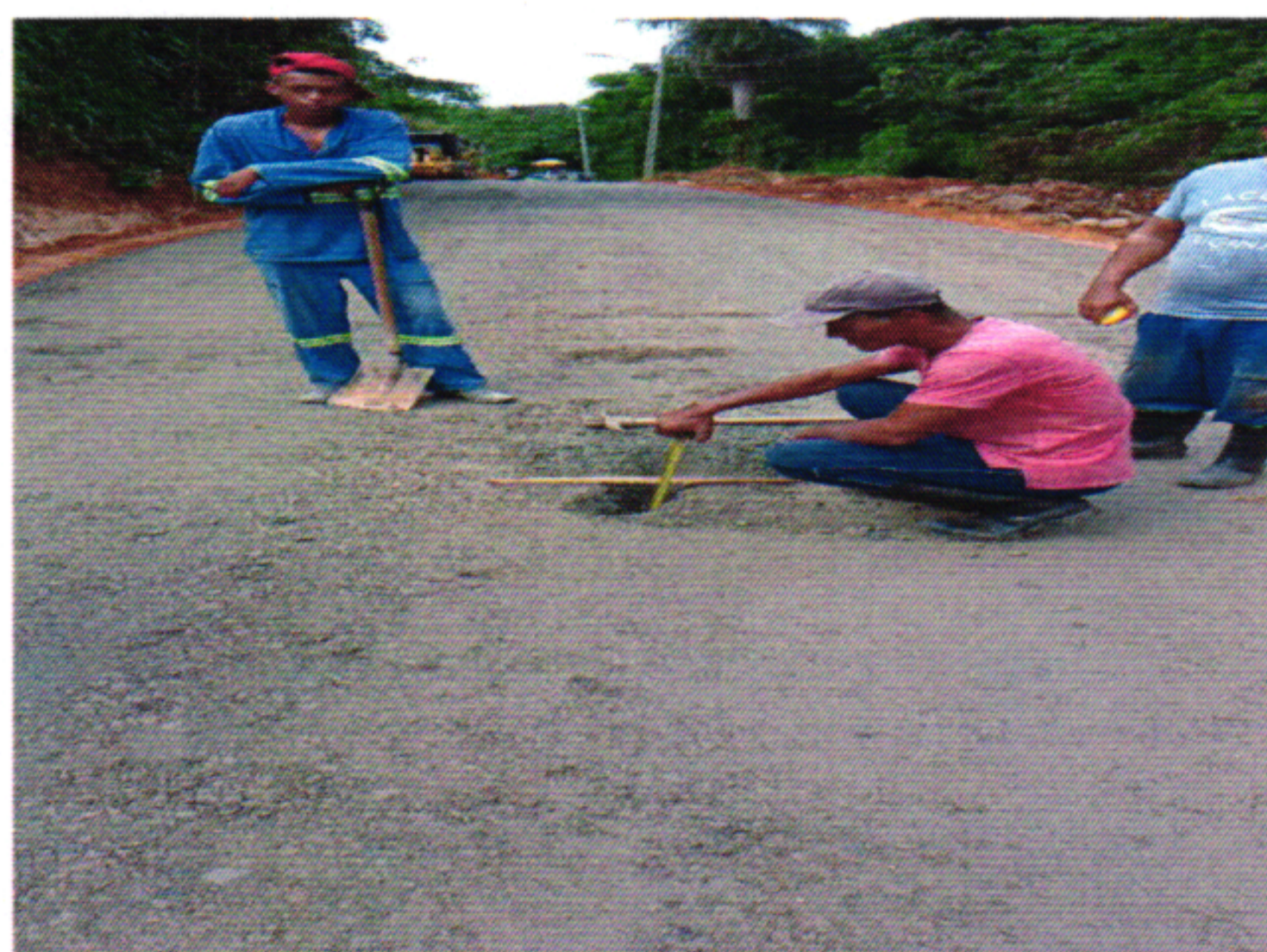
ESPESSURA BGS 2