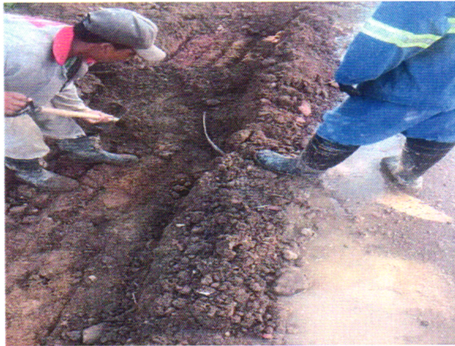
REBAIXAMENTO DE REDE