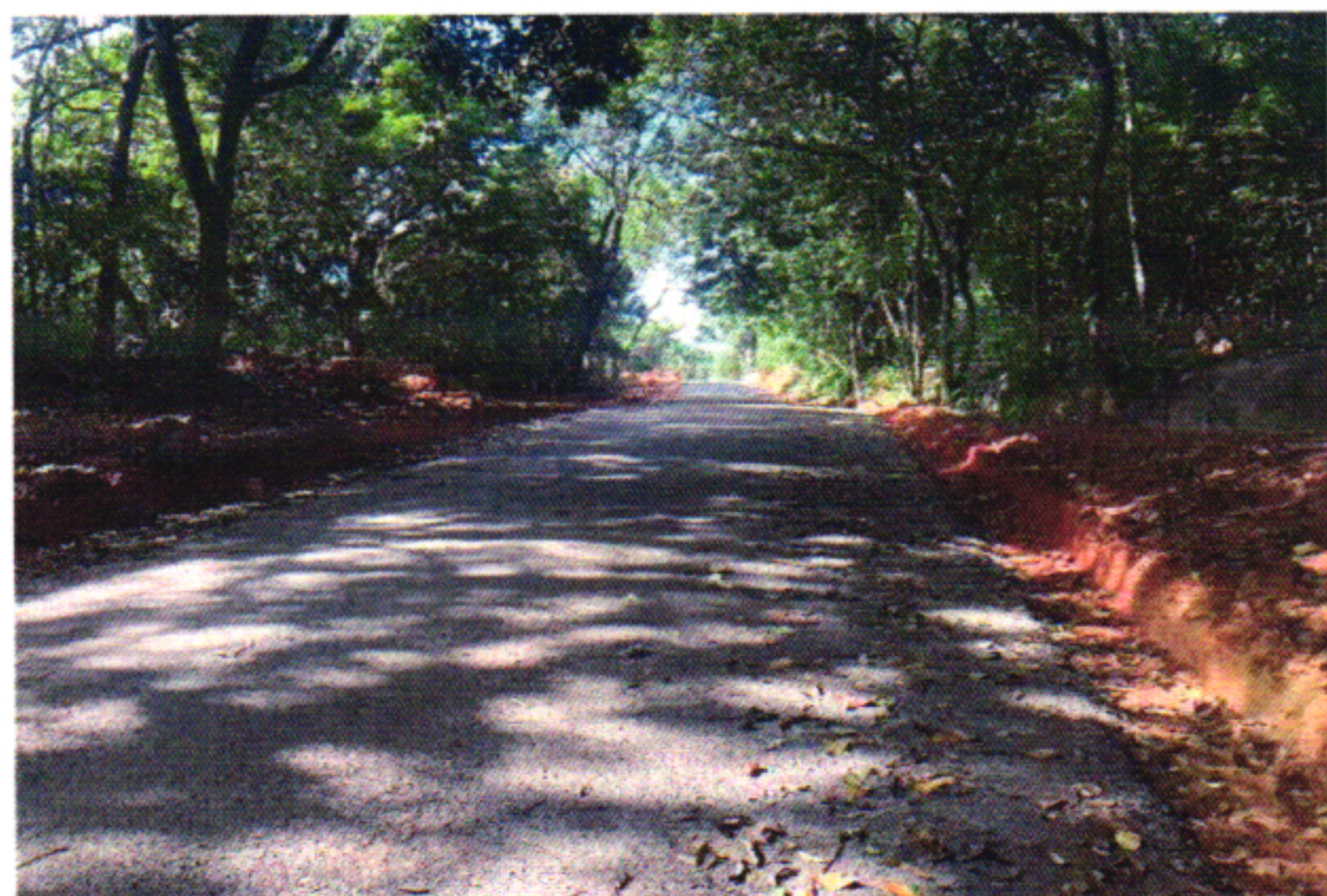
EXECUÇÃO BGS 5