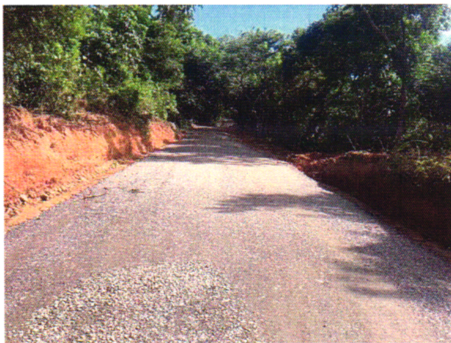
EXECUÇÃO BGS 15