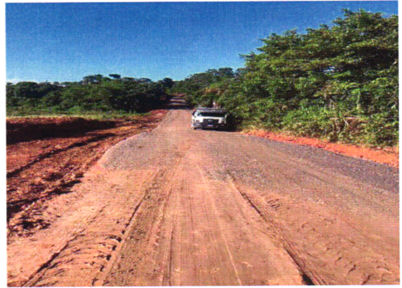
EXECUÇÃO BGS 10