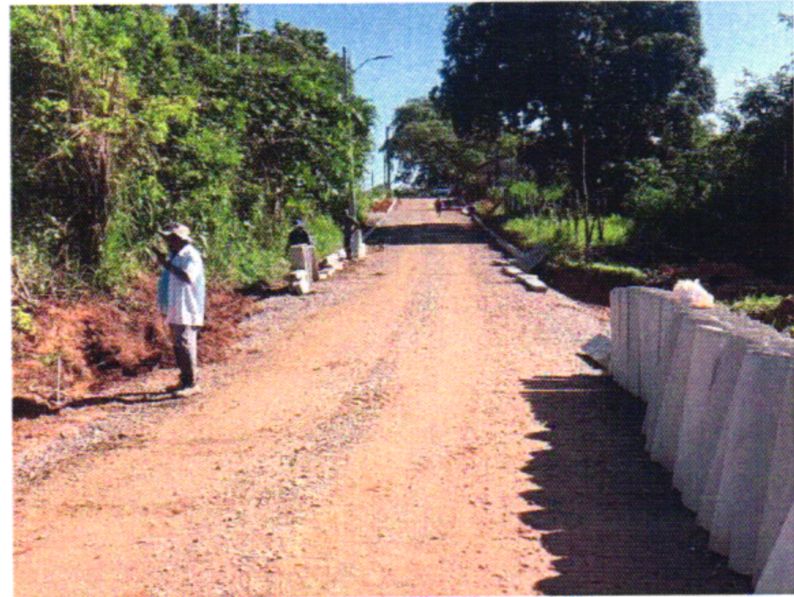
MEIO FIO 2