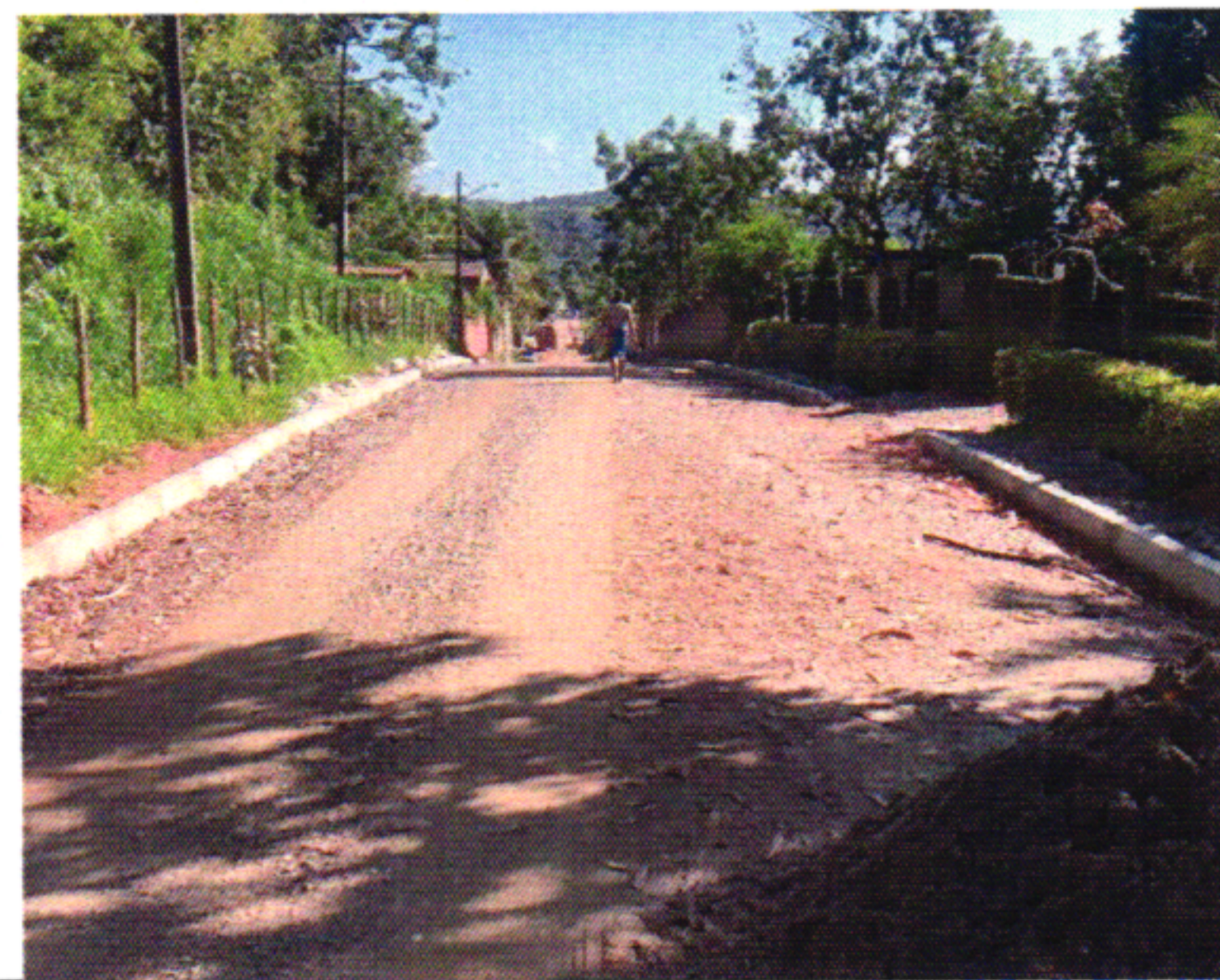
MEIO FIO 6