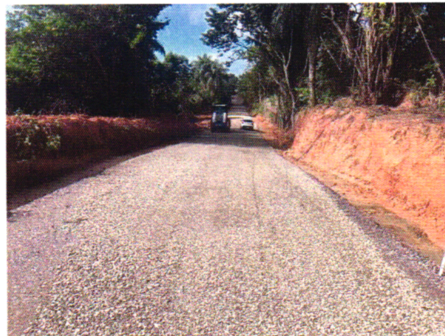
EXECUÇÃO BGS 16