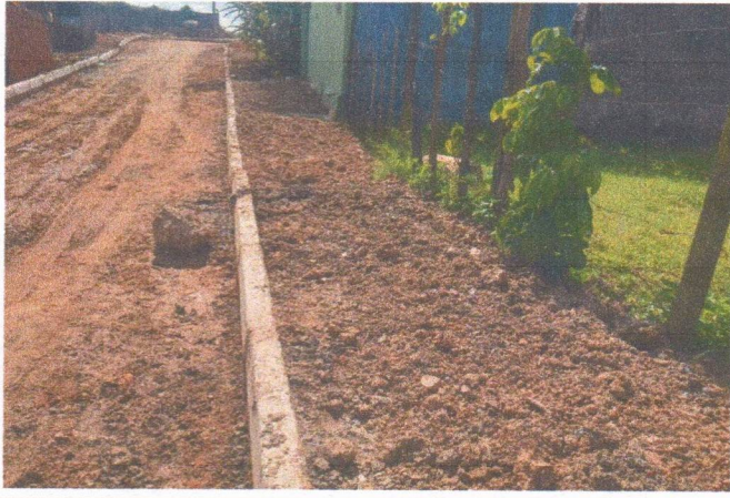
RUA CANTOR NELSON GONÇALVES