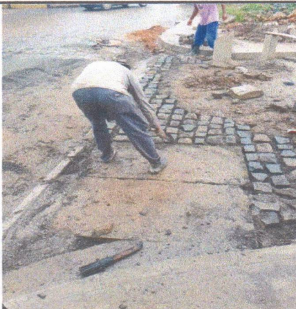
RUA CANTOR NELSON GONÇALVES