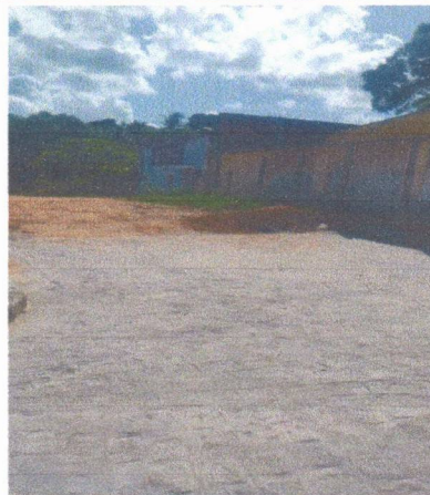
RUA CANTOR NELSON GONÇALVES