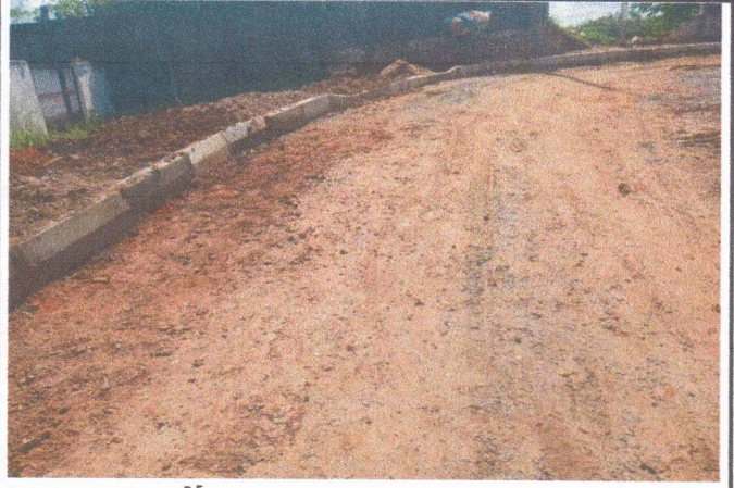
RUA CANTOR NELSON GONÇALVES