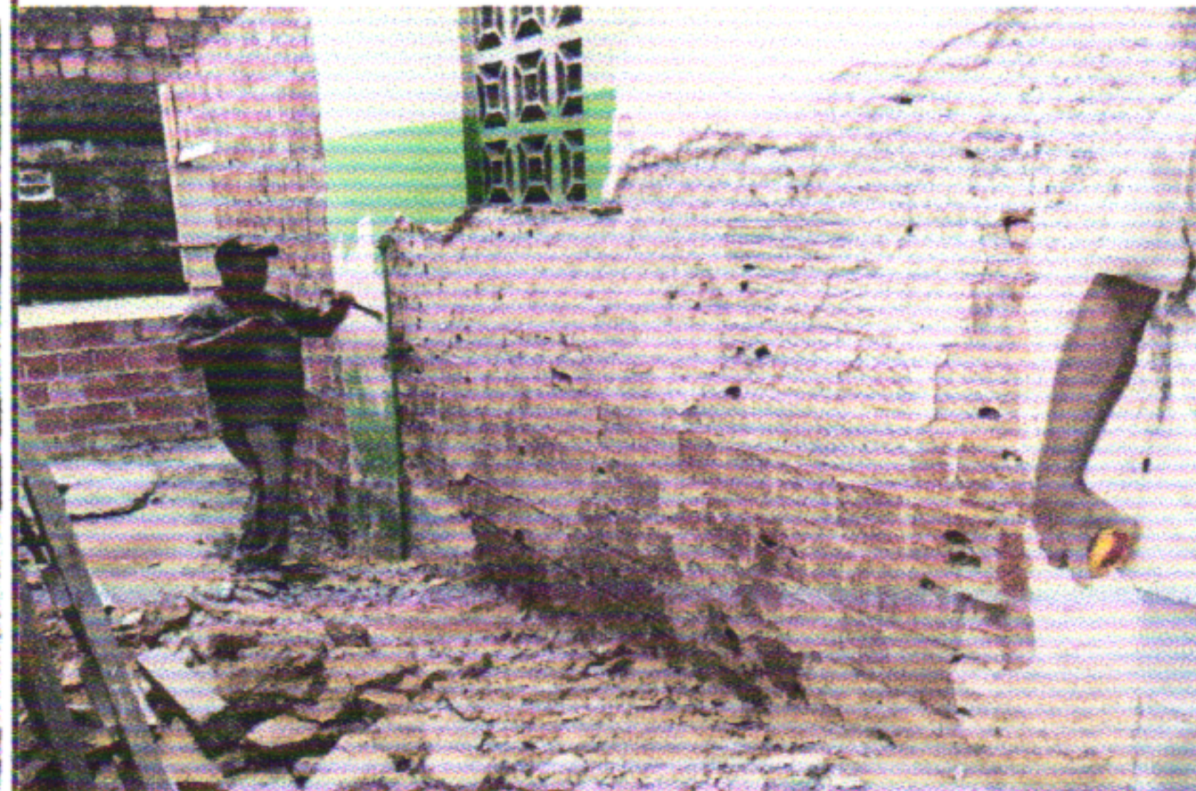
DEMOLIÇÃO DE TODO O REBOCO