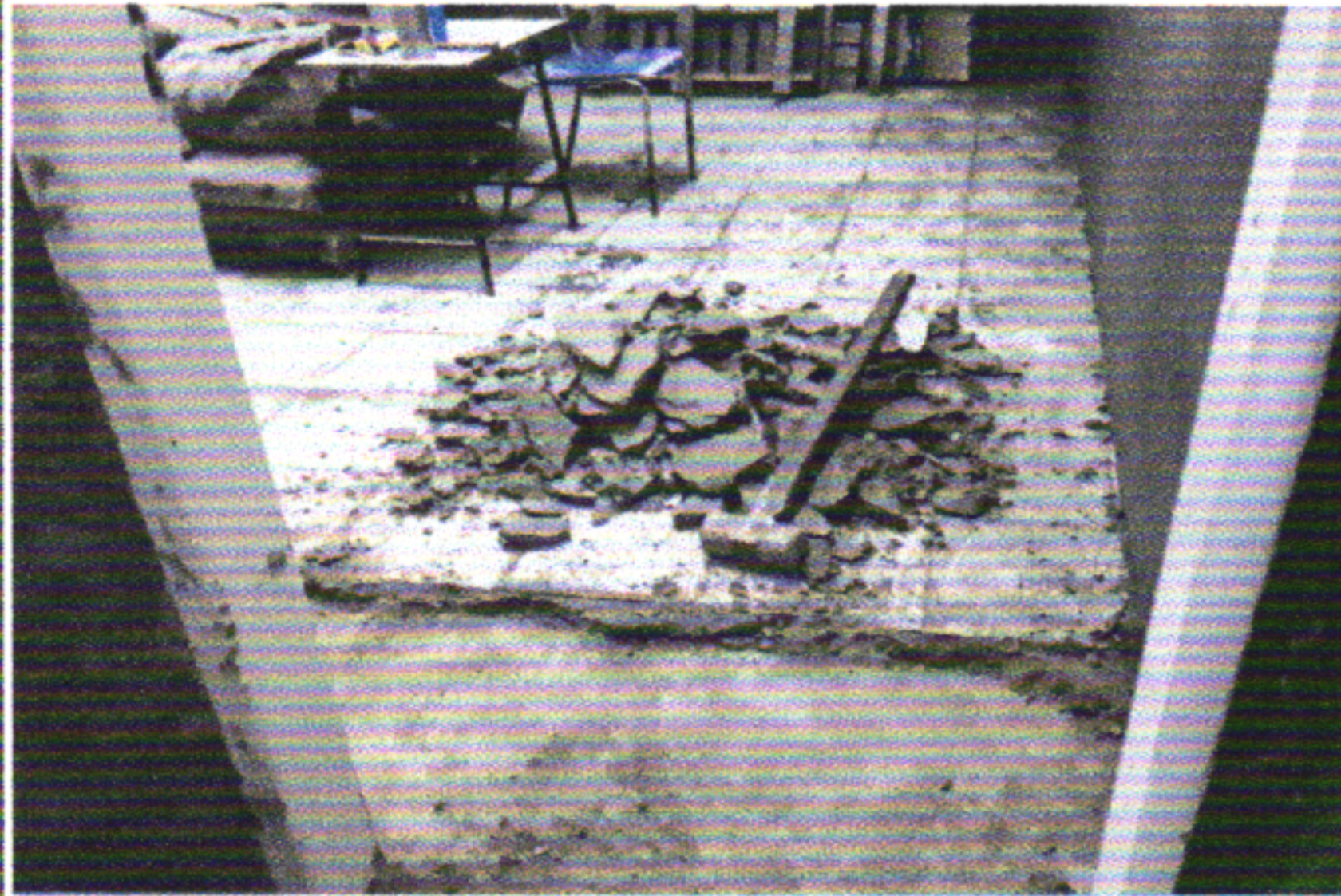
DEMOLIÇÃO DO PISO