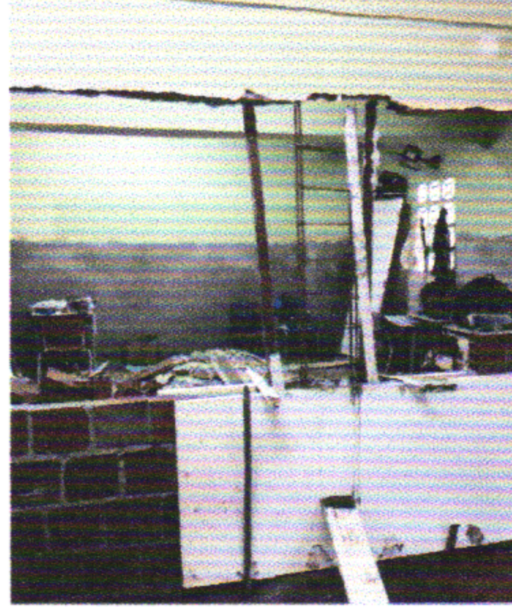
DEMOLIÇÃO DE ALVENARIA ENTRE AS SALAS 3 E 4