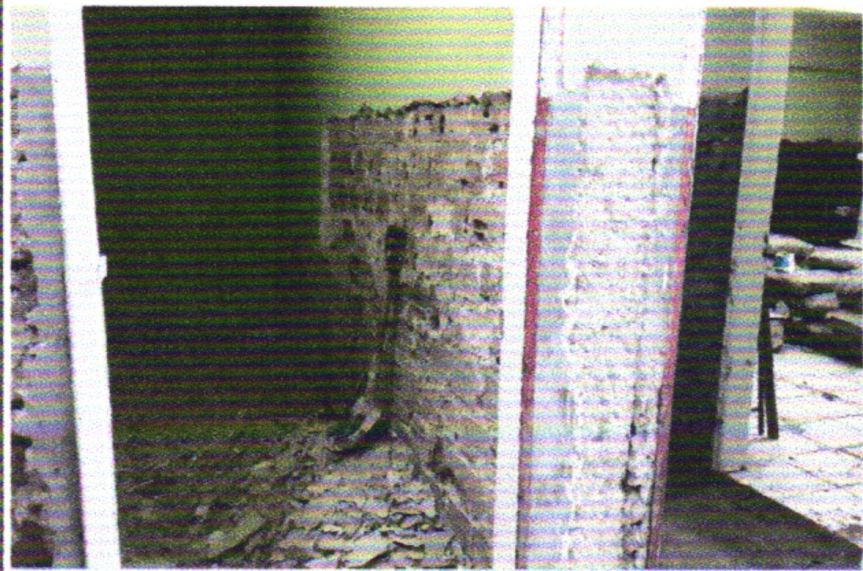
DEMOLIÇÃO DE TODO O REBOCO