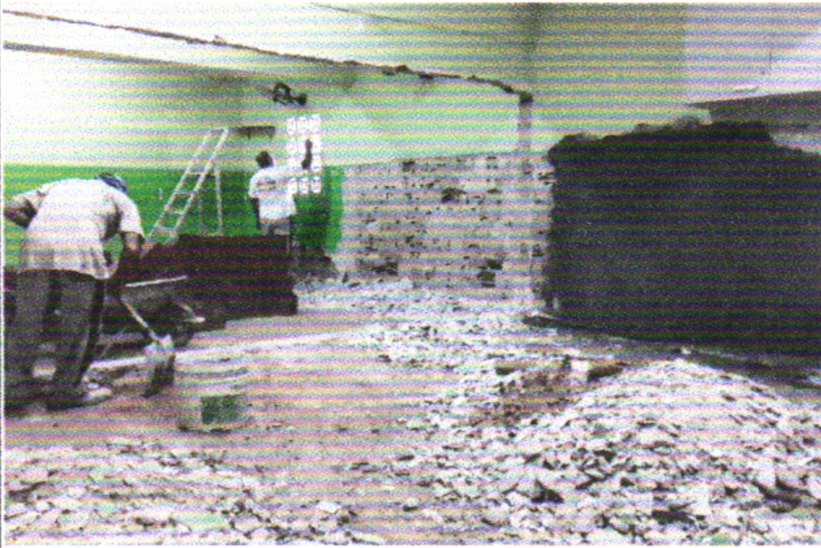
DEMOLIÇÃO DE ALVENARIA ENTRE AS SALAS 3 E 4