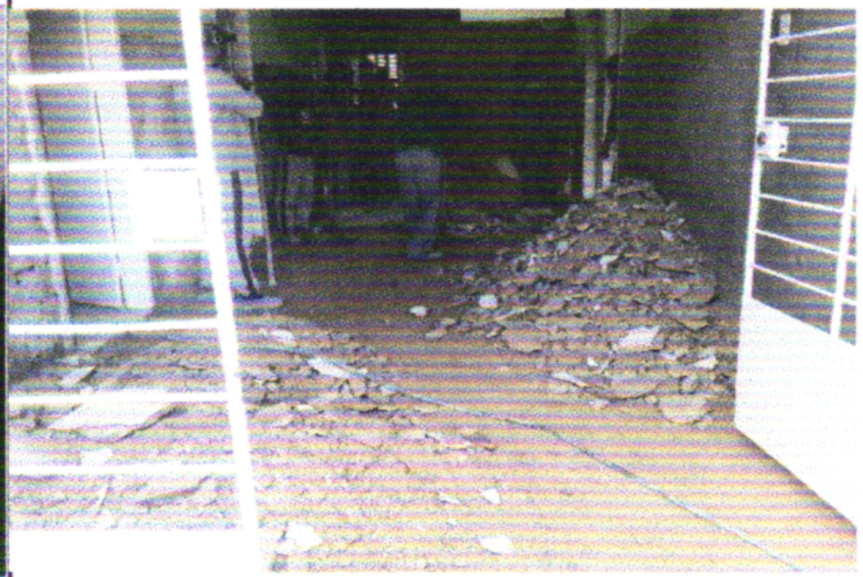
DEMOLIÇÃO DO PISO