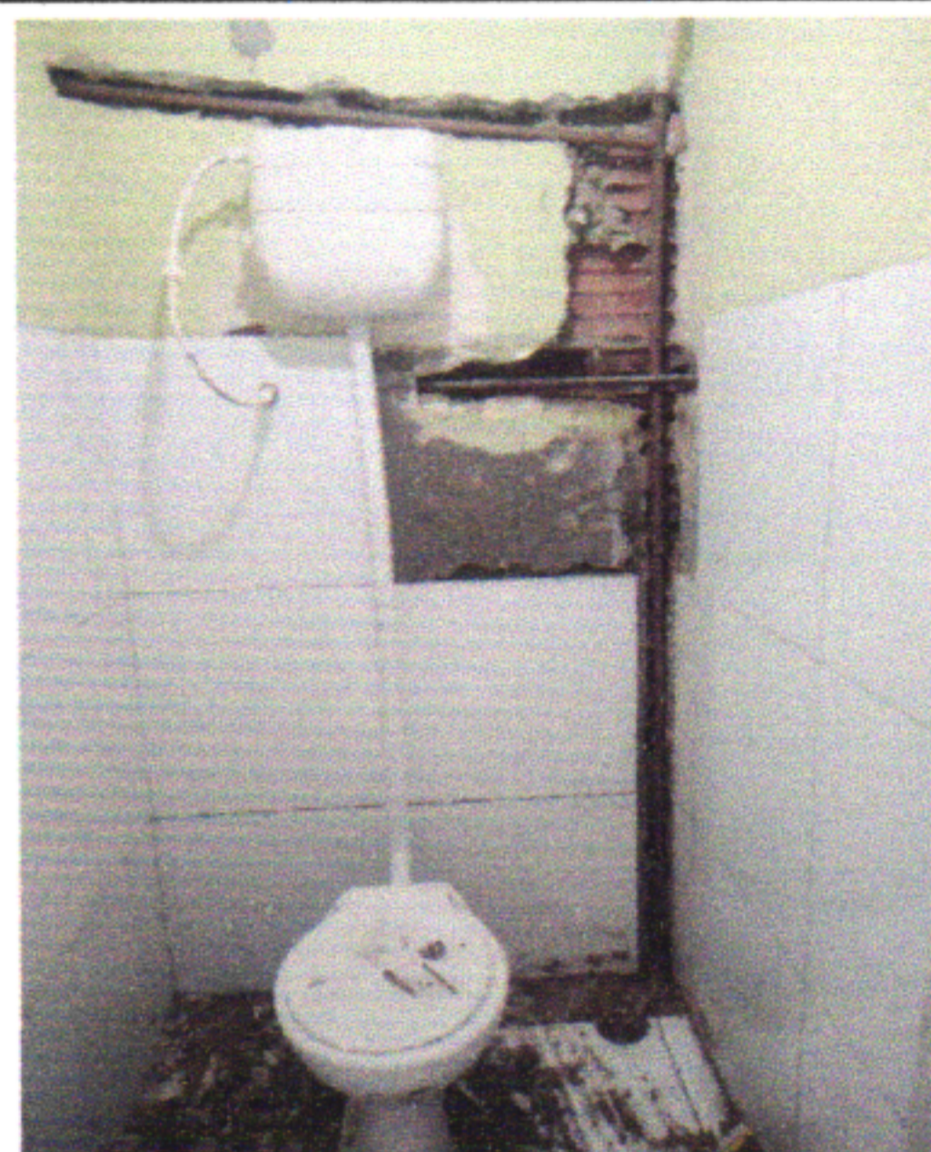
VASO SANITÁRIO COM CAIXA DE DESCARGA, ENGATE