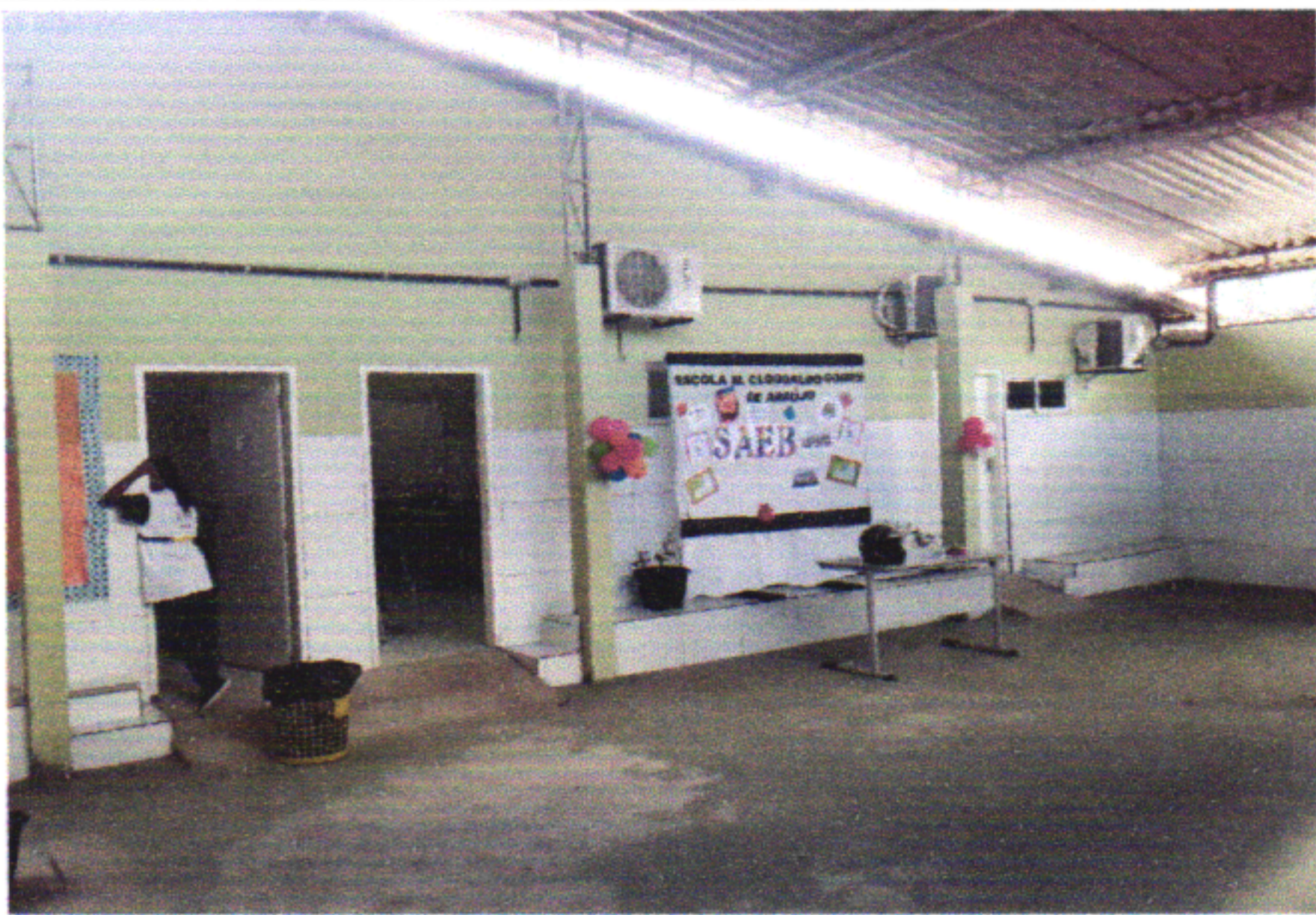
APLICAÇÃO SELADOR, MASSA, LIXAMENTO, PINTURA, PISO CIMENTADO