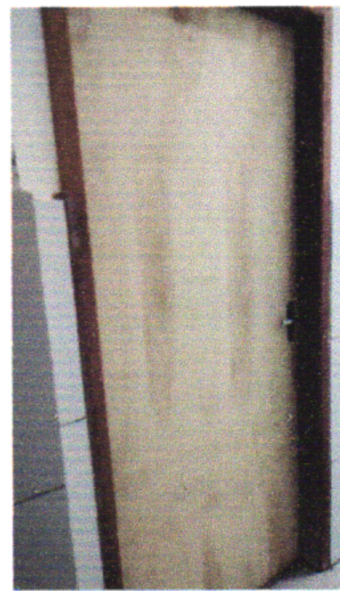
KIT PORTA, FECHADURA