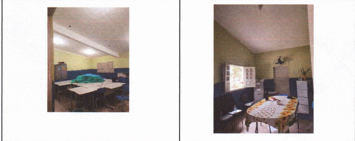
SELADOR DE TETO PINTURA DE SELADOR NO TETO