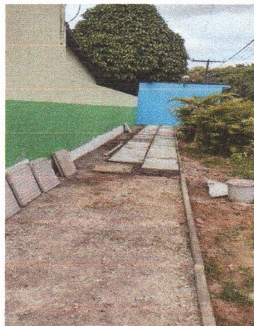
ASSENTAMENTO DE LAJOTA