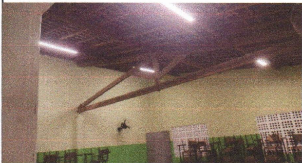
FORNECIMENTO E INSTALAÇÕES DE LUMINÁRIAS