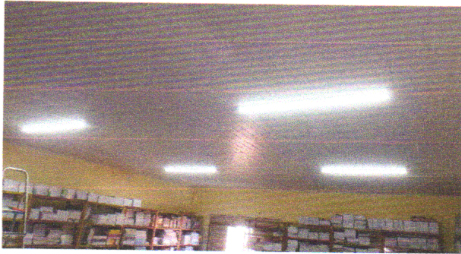
FORRO EM RÉGUAS DE PVC E LUMINÁRIA LED