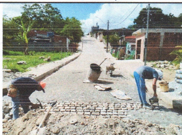
RUA BUIQUE - PAVIMENTAÇÃO