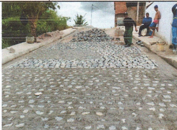
RUA JOSEFA DA CUNHA - PAVIMENTAÇÃO

PROPONENTE: PREFEITURA DE SÃO LOURENÇO DA MATA/PE OBJETO: PROJETO PARA EXECUÇÃO DE PAVIMENTAÇÃO E DRENAGEM DO BAIRRO DE VILA DOURADA NO MUNICÍPIO DE SÃO LOURENÇO DA MATA/PE. EMPREENDIMENTO: CONSTRUÇÃO DE RODOVIAS E FERROVIAS