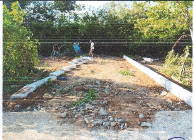
RUA CLÁUDIA MOTA - PAVIMENTAÇÃO