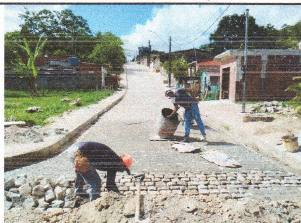
RUA BUIQUE - PAVIMENTAÇÃO