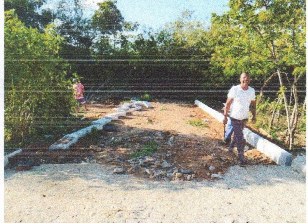
RUA CLÁUDIA MOTA - PAVIMENTAÇÃO

PROPONENTE: PREFEITURA DE SÃO LOURENÇO DA MATA/PE OBJETO: PROJETO PARA EXECUÇÃO DE PAVIMENTAÇÃO E DRENAGEM DO BAIRRO DE VILA DOURADA NO MUNICÍPIO DE SÃO LOURENÇO DA MATA/PE. EMPREENDIMENTO: CONSTRUÇÃO DE RODOVIAS E FERROVIAS