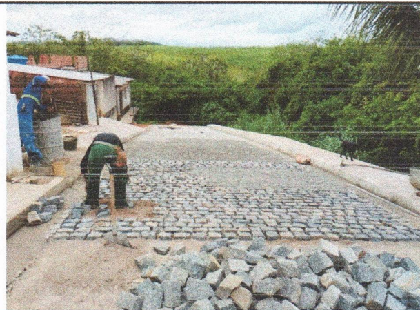
RUA JOSEFA DA CUNHA - PAVIMENTAÇÃO