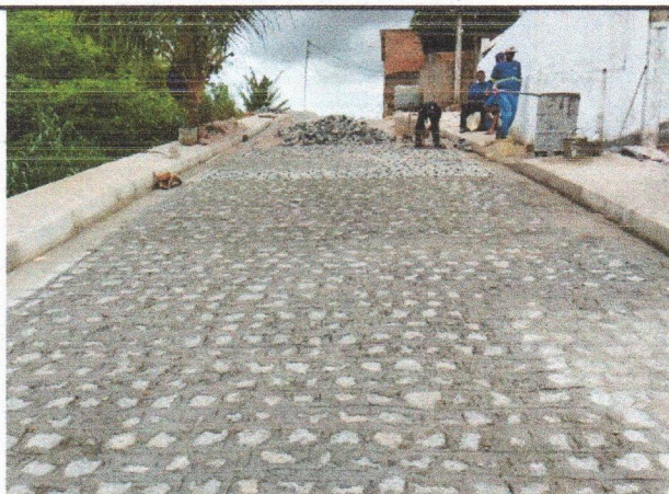
RUA JOSEFA DA CUNHA - PAVIMENTAÇÃO