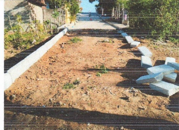
RUA CLÁUDIA MOTA - PAVIMENTAÇÃO