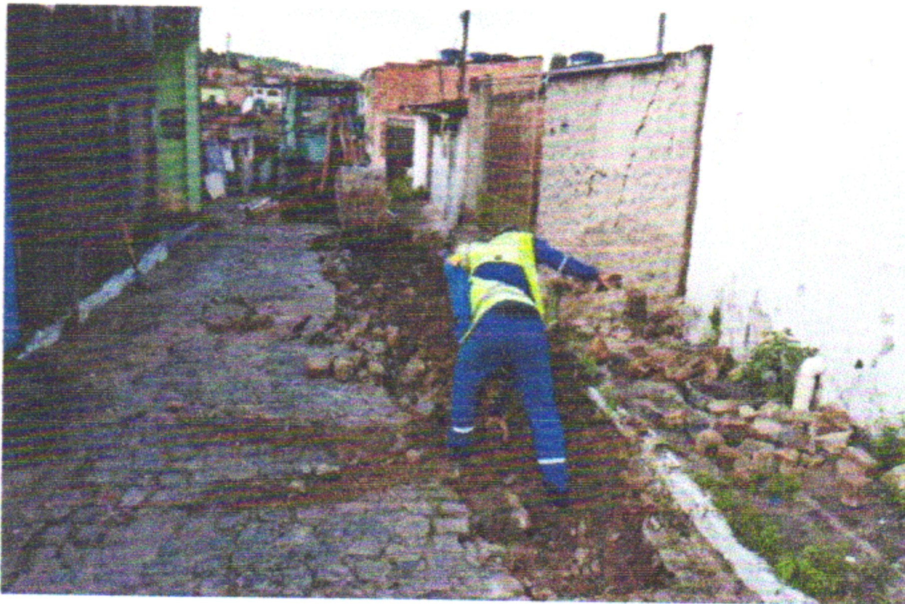
RUA DOS CRAVOS