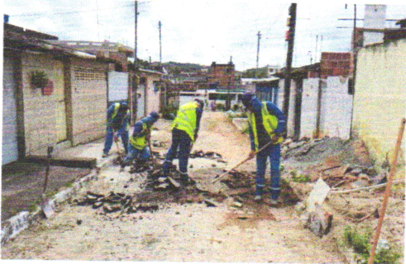
RUA DOS LÍRIOS