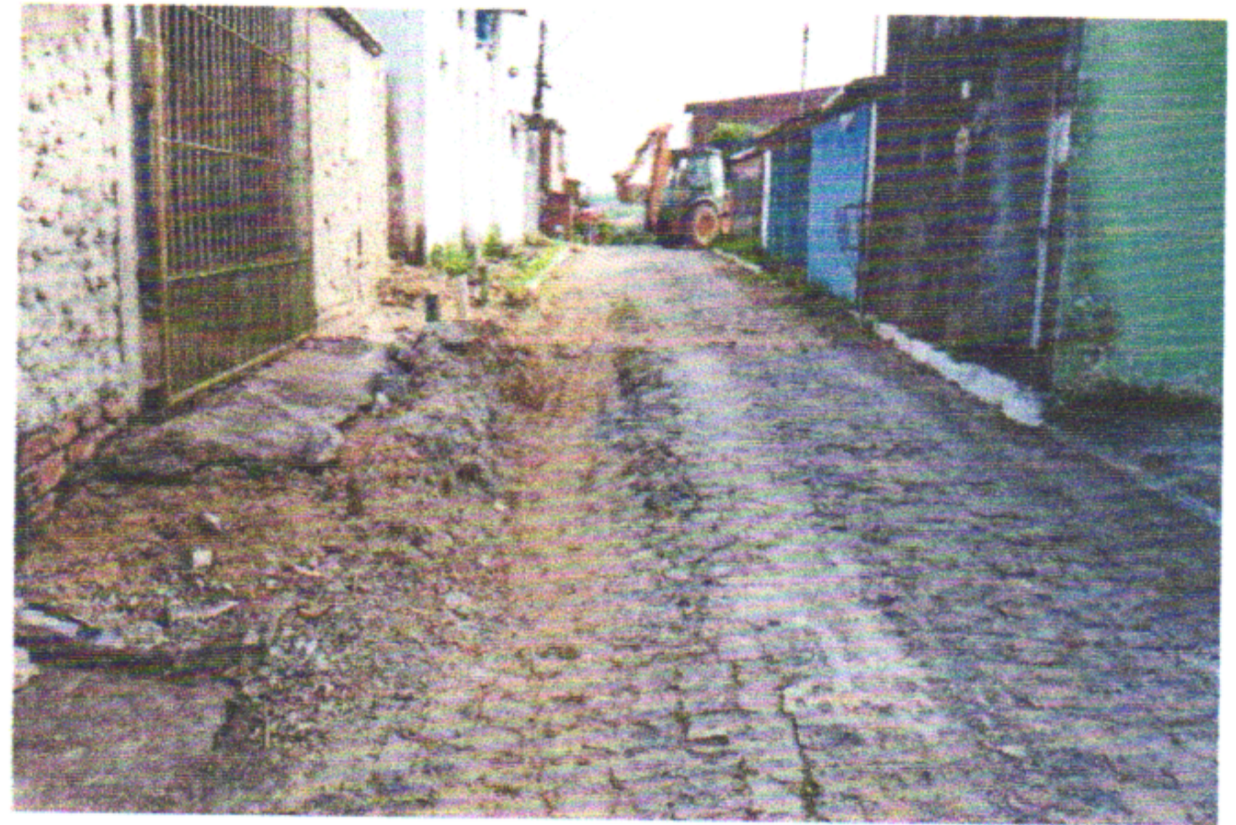
RUA DOS CRAVOS