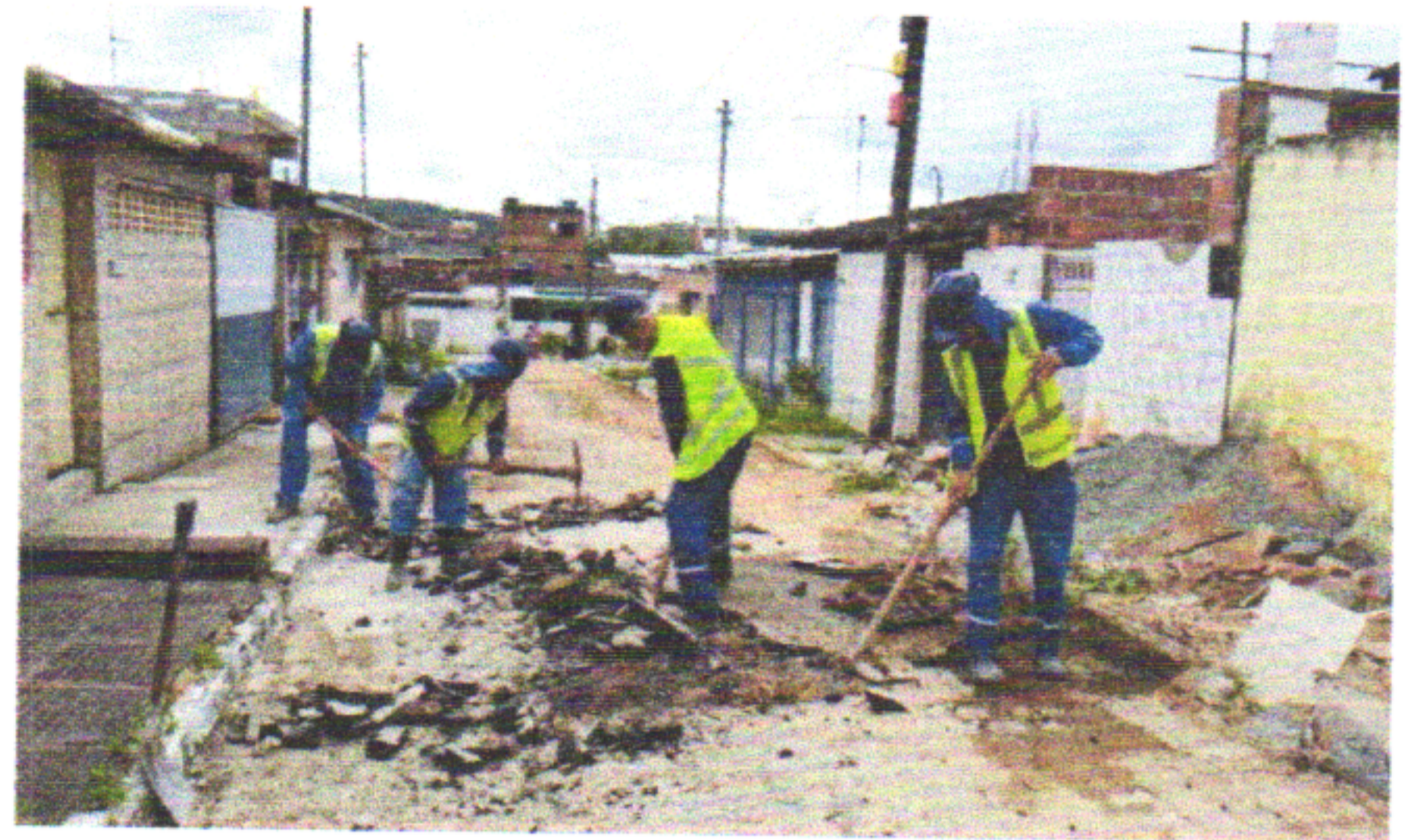
RUA DOS LÍRIOS