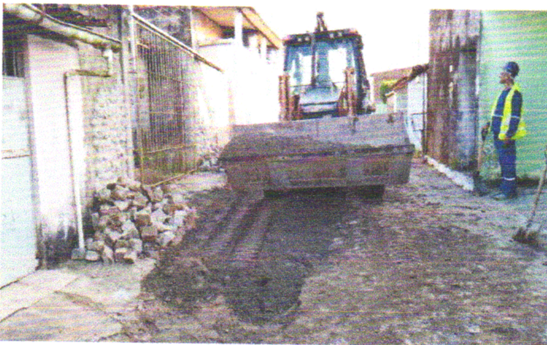
RUA DOS CRAVOS